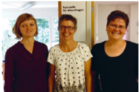
Team Fachstelle Breitenbach